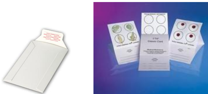
Figura 8 – Envelope do FTA Card e FTA Card prontos para submissão