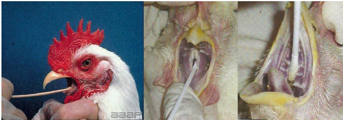
Figura 1 – Suabes de traquéia e fenda palatina (coana)