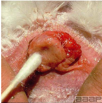
Figura 3 – Suabe de cloaca de perus para pesquisa de Mycoplasma meleagridis