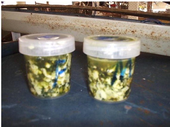
Figura 5 – Frascos estéreis contendo mecônio

Bolsa de amostra ou frasco estéril (Figura 5).