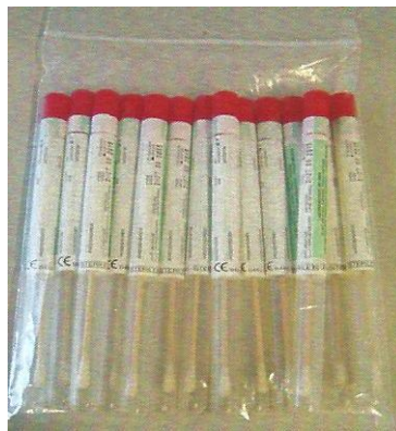
Figura 2 – Bags ou sacos plásticos resistentes e limpos contendo suabes

Bolsa de amostra ou frasco com tampa rosca. De preferência os suabes devem ser transportados em sacos plásticos resistentes e limpos (Figura 2).