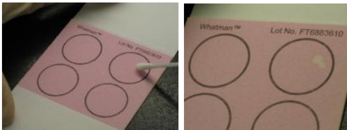
Figura 7 – Amostra sendo aplicada com suabe no FTA Card

Para suabes: Transferir o conteúdo dos suabes (traquéia ou outros órgãos) pressionando sobre o FTA Card (Figura 7). Quando for suabe: 20 aves comporão um cartão. Cada 5 suabes de traquéia compõe 1 círculo do FTA Card.